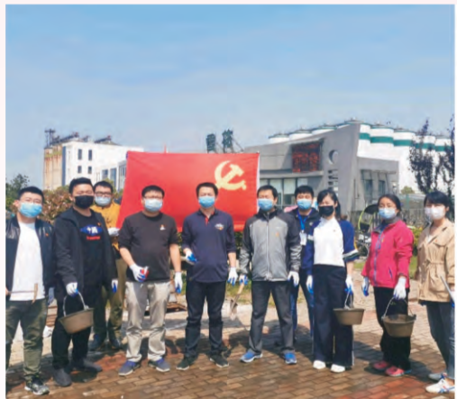
4月24日，黄金山供水分公司党支部利用主题党日活动开展“表井消杀及供水设施检查保养”活动，全体党员积极参加。此次活动对大棋路、宝山路沿线企业用户的表井盖进行了清理、消毒，对水表前后的供水设施进行了检查和保养。通过询问用户用水情况、听取用户意见等措施，进一步优化营商环境，保障企业复工复产。（王子昕 刘倩）