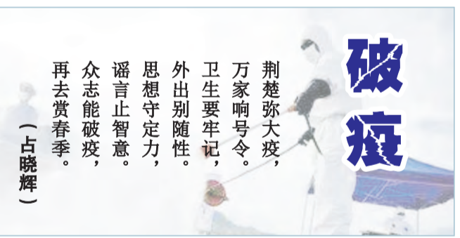
破疫 荆楚大疫，万众一心，众志成城，万众一心，众志成城，万众一心，众志成城。

春咏 (一) 春风拂面江北滩，疫后再见恨相晚， 畅叙往昔欢乐事，漫步散花盟意志， 开怀对饮有几人，旷野江边醉几分， 流连忘返怎奈何，邀约他日再高歌。 (二) 江南春岸又一年，遥想往昔与昨天， 似曾不堪回首望，始终难忘少年狂， 军旅时期虽短暂，兄弟情深永不散， 他日再见叙寒暖，终身无悔寻梦还。 (方华强)