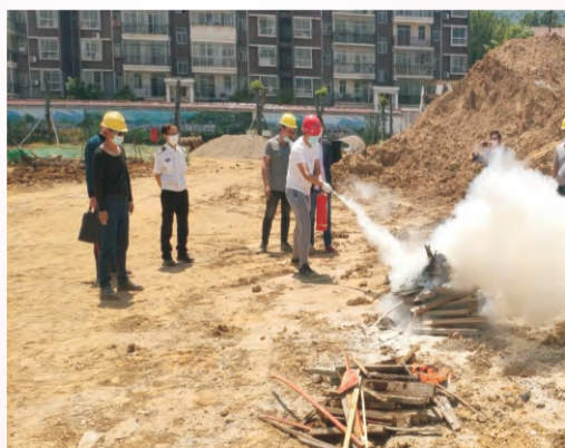
4月29日，建设工程有限公司在建项目应急水源下陆加压站改扩建工程联合工程所在地老鹤庙社区联合组织开展消防安全教育活动。通过学习和实操，提高项目管理及施工人员的安全意识和消防本领，加强火灾事故的防范工作，确保施工现场的消防安全，营造重视消防安全的良好氛围。（邓宏程）