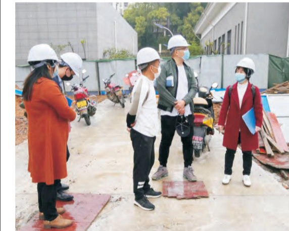
本报讯：为了贯彻落实好省市、集团关于疫情期间安全生产决策部署，公司安全生产部、办公室、武保(稽查)部、纪检监察部等相关部室主动履职尽责，自全面复工以来，先后5次下沉基层，通过“查、问、谈”等方式，检查督促指导各单位疫情防控及安全生产工作，查看疫情防控记录40余份，深入新建、改扩建工程工地4个，经多轮宣传、检查和督导，共规范整改隐患10余处，促进干部职工防范意识进一步提高，保障了公司疫情防控新常态下的安全生产形势平稳。(占艳艳)