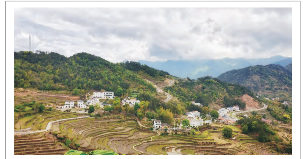
雾云山梯田

温暖 突如其来的新型冠状病毒疫情爆发，打乱了大家的新年计划，也改变了我们的生活。与往年新春伊始的喜庆氛围不同，今年多了一些沉重与感伤。 我的主要任务是对所在楼栋进行包保，小区是病例重灾区，为进一步掌握居民的实际情况，落实好防疫工作，在做好个人防护措施后，我多次逐门逐户进行信息采集、测量体温，做到精准排查全覆盖。为便于工作开展，将住户都拉入了楼栋微信群。小区封闭管理后，对于居民所需购买的蔬菜、家用品等生活物资，我分门别类做好登记，帮忙订购，并送到各家各户。楼栋有47层，225户，而包保责任人只有我和我爱人2名党员，所有居民的吃穿用度问题我们都要操心，可以说任务是比较重的，有时忙起来连饭都没有时间吃。同时不乏有些居民把自愿者当成了呼来喝去的工具，提出一些过分且无理的要求，稍微一点不如他意，便破口大骂，并威胁要打电话投诉。当然这毕竟极少数人，大多数居民都是非常和善的人。因为有些老人不会使用微信报体温，我坚持每天给他们打电话，一来是询问他们的身体情况，确保他们平安。二来是陪他们聊聊天，问问他们需要些什么，帮他们买些生活所需的东西。打了几十天电话，我也和他们熟悉了起来，有时老人会问我吃没吃饭，如果没吃饭就到他家来吃。一位婆婆说：“小姑娘，有没有什么需要帮忙的，有的话告诉我，发订购生活物资的时候，忙不过来可以来帮你忙！”很多这样的小事，都让我挺感动的，感觉大家的心与心在贴近，居民把我们看做了自己的朋友。外面寒风习习，楼栋内却让人感到暖意融融。病毒肆虐，我们虽被暂时禁锢了脚步，但我们却并不孤单，而是铸造了一个和睦的大家庭！ 疫情期间，我们看到了白衣天使的冲锋在前，看到了民生保障部门职工的默默坚守，看到了社区工作者、志愿者们的辛勤奉献……当然，还有着这些平凡且可爱的居民，他们听从指挥，乐观开朗，守望相助，共克时艰。“家是最小国，国是千万家”。正是由于大家的共同努力，我们的社会才会如此的温暖！ (林晓雪)