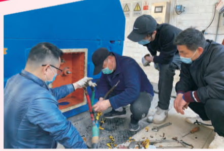
为保障全市民用水安全，4月9日晚，公司对主供水管网阀门及水厂供水设备升级改造，先后更换管网阀门两台套及厂内供水设备升级改成一整套变频机组，改造完成后进一步提升供水安全保障。（王庆）