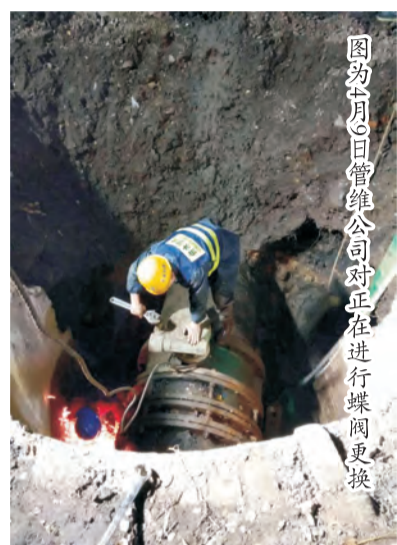
图为4月9日晚管维公司对正在进行的阀门更换

9日晚9点，经过白天调动设备开挖近4米深宽2米深工作坑，设置防护围栏、调装阀门、拆卸螺丝，一切准备工作就绪。该公司迅速启闭了五台阀门，晚11点止水，调装阀门，三个工地分步进行更换，一切按计划有条不紊地进行，10号早6时该公司顺利完成了三台大型阀门更换任务。（张荣/文）